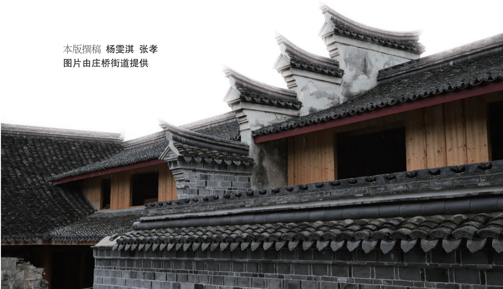
马径村古建筑一角